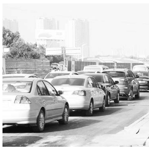
大众报业记者 张泰来 报道 施工改造导致济南部分道路不畅。