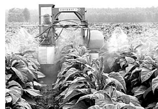
在孟友烟农专业合作社，在飞机喷不到的地方，使用植保机喷洒农药，一天喷药上百亩，而且雾化效果好。

8月22日上午，一架小型无人机“嗡”一声飞起，在一片黄烟地里喷洒药物，一趟来回，几十亩黄烟喷完。这是贾悦镇孟友烟农专业合作社的飞机喷洒现场。