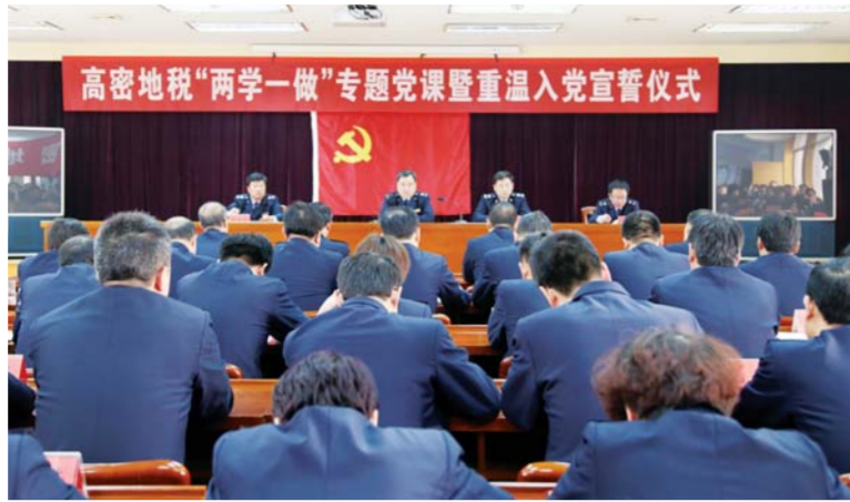
△举行“两学一做”专题党课暨重温入党誓词仪式