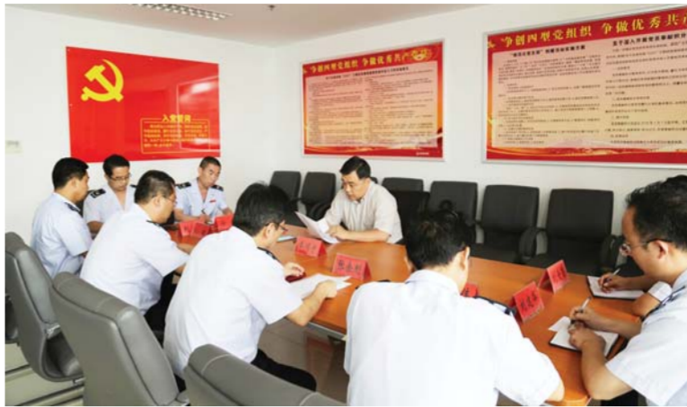
△开展领导班子成员讲党课活动