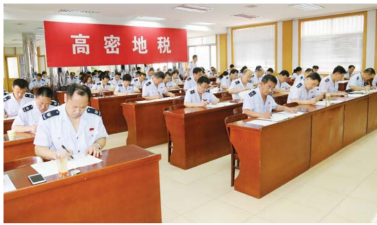
△组织举办《党章》知识考试