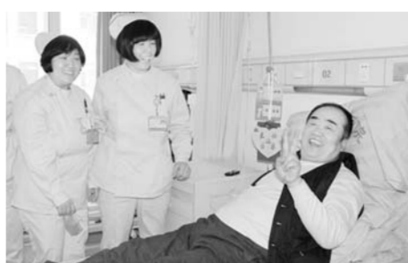
△脑病科医护人员为患者过生日

精湛的医疗技术，核心是人才，让我们检索一下省中医闻名全国的中医大家——高德俊，国医大师，著名周围血管病外科专家。在国内开辟了中西医结合治疗周围