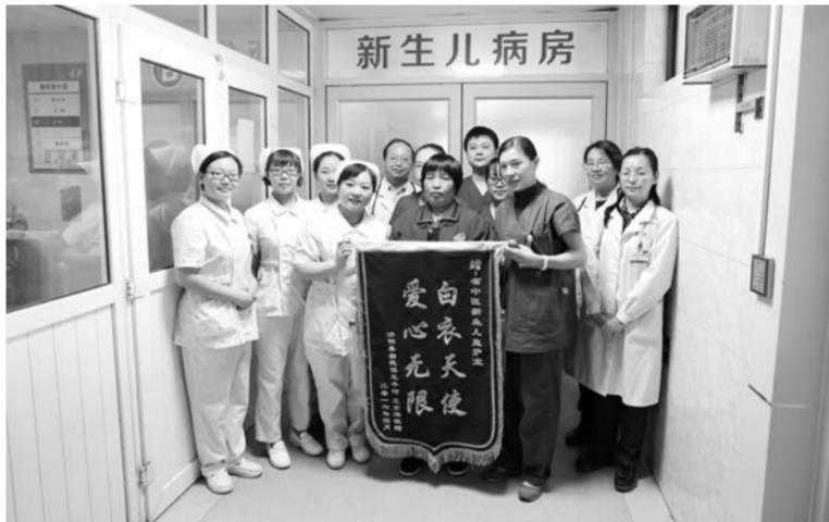
△危重患儿家长向新生儿科赠送锦旗