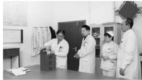
△肝病科为家庭困难的患者捐款