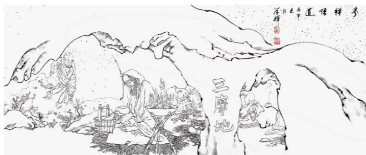
李学辉 《五百僧像尚和图》之参禅悟道(局部)