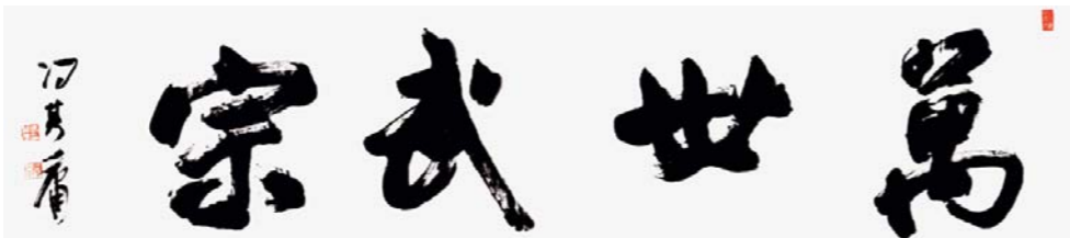
冯其庸为李学辉《孙子圣迹图》题字：万世武宗

郭明良1963年生于胶州，1982年拜入谷宝玉门下习画，谷宝玉师承近代国画大师李苦禅。郭明良绘画风格多元，善于尝试创新，作品独立感强。