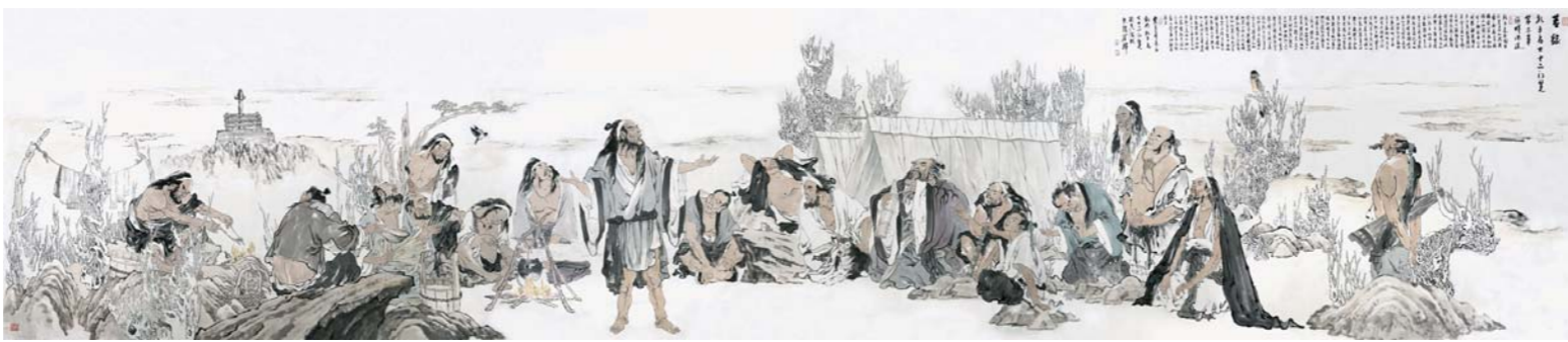
李学辉 《苦旅-孔子与七十二门贤》第二章 河畔论道