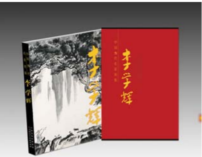
《中国当代名家画集——李学辉》出版

由天津人民美术出版社出版的“大红袍”系列之《中国当代名家画集——李学辉》日前正式出版，即将在全国新华书店发行。