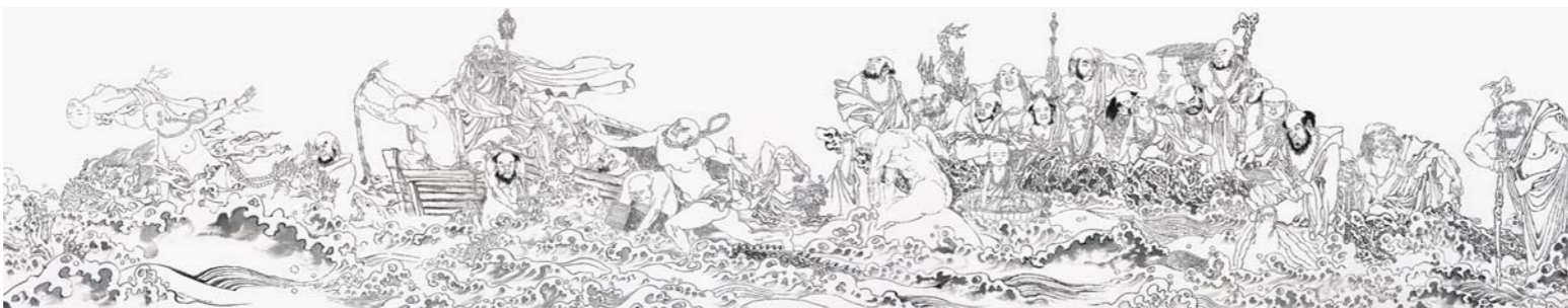
李学辉 《五百僧像尚和图》之慈航普度(局部)