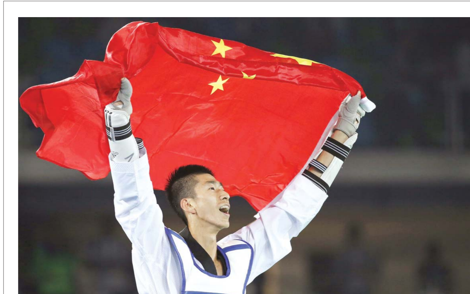
北京时间8月18日，夺得2016年里约奥运会跆拳道男子58公斤级冠军的赵帅，手举国旗，绕场庆祝。