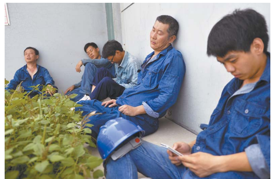
这个小小的音儿，是他们能够坐下来小憩、又不受烈日炙烤的“宝地”。