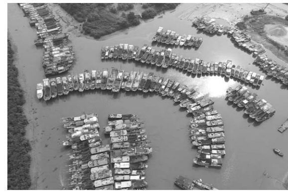
新华社发 8月1日，大批渔船在广东省台山市横山渔港避风。

据中央气象台发布的台风预警：今年第4号台风“妮妲”将于2日凌晨到上午在广东汕尾到阳江一带沿海登陆，登陆时为台风级或强台风级(40-48米/秒，13-15级)。受台风影响，广东沿海渔船纷纷回港避风，推迟出海。