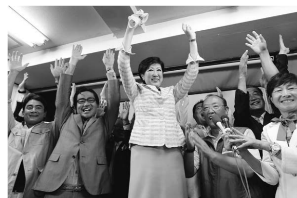
7月31日，在日本东京，小池百合子(中)庆祝当选东京都知事。据日本广播协会(NHK)报道，在当日进行的东京都知事选举中，前防卫大臣小池百合子确定当选，成为东京首位女性都知事。

据新华社北京8月1日电 民政部副部长李立国1日说，地方各级民政部门应按要求及时、准确、规范统计上报灾情，对故意瞒报灾情，造成恶劣后果和严重影响，应按有关规定和干部管理权限追究责任。李立国在此间召开的全国民政系统防灾减灾工作视频会议表示，地方各级民政部门要高度重视做好灾情报送工作，确保制度到位、人员到位、责任到位，避免迟报、漏报灾情，杜绝瞒报灾情。对于山洪、泥石流、山体滑坡等突发性重特大自然灾害，尤其是造成灾区交通、电力、通讯中断的情况，李立国指出，各地应迅速组织力量就此开展灾情核查工作。灾情稳定后，应当及时评估、核定并按有关规定发布自然灾害损失情况。