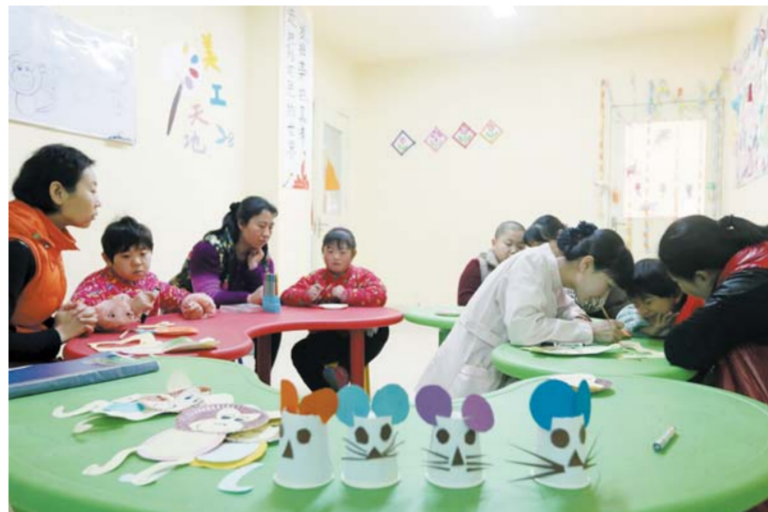
△福康幼儿园里的手工课

展导乐分娩、人陪伴分娩、无痛分娩；第一个女子保健中心；第一个专业的儿童保健中心；第一个儿童康复中心，是“山东省贫困儿童脑瘫康复训练基地”、“山东省智力、孤独症康复训练基地”。实现了妇幼保健和计划生育技术服务的无缝对接，医育共赢。