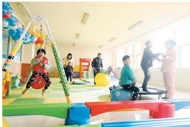
△宽敞的儿童康复训练室