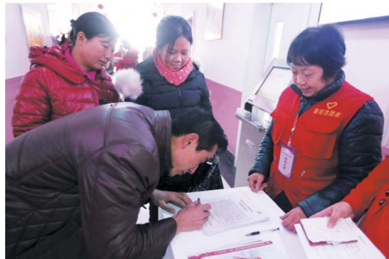
△“妇幼天使”社会志愿服务队