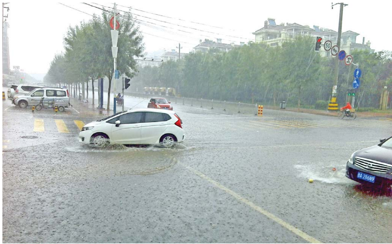
济南昨日迎来三场来去匆匆的降雨。图为7月18日下午3点左右,济南市高新区下起大雨。

赵润田要求,各级各部门要认真贯彻落实省委、省政府主要领导重要指示精神,迅速组织发动,明确重点,强化责任,全面抓好水利工程调度、城市防汛排涝、山洪灾害防御和工矿企业、旅游景区防汛等工作,将各项防汛措施严格落实到实处,努力将损失降到最低程度。