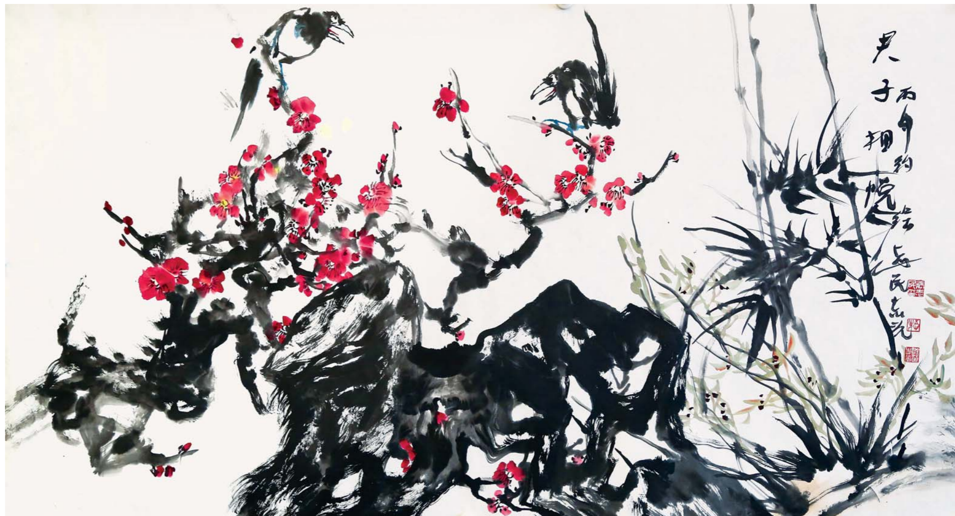
郭志光 张志民 君子相悦 180cm×97cm