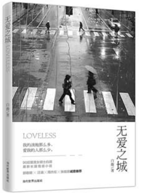
《无爱之城》 白薇 著 当代世界出版社

书中结合古窑址考古资料、墓葬发掘资料以及最新的研究成果，以一种通俗易懂的话题方式，带给读者更专业的中国古代瓷器知识，为瓷器爱好者们提供参考和借鉴。