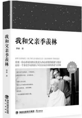
《我和父亲季羨林》(修订版) 季承 著 鹭江出版社

从儿子的视角讲述了把自己一生都贡献给了国家和社会的大师的家庭生活，表现了他纷乱复杂的家庭情结——从一个农村家庭来到一个城市家庭，他与城市这个家庭格格不入；农村的那个家，距离也越来越远了。