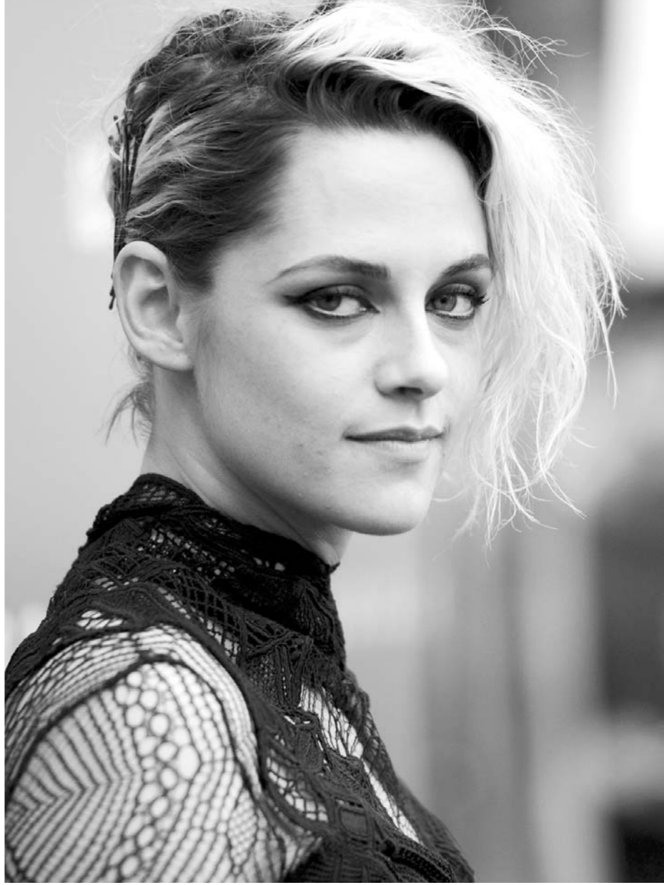
□CFP 供图 当地时间7月7日，电影《同等族群》在美国好莱坞举行首映礼。图为影片主演、“暮光女”克里斯汀·斯图尔特现身助阵。据悉，该片将于7月15日在北美上映。

当然，促使格列兹曼继续进球的动力还有决赛的对手C·罗纳尔多。两个月前，格列兹曼罚丢点球，导致马竞在欧冠决赛中不敌C·罗纳尔多领衔的皇马。两个月后，格列兹曼又迎来了复仇机会，他渴望像当年齐达内射杀同样有着罗纳尔多的巴西队一样，射杀拥有C·罗纳尔多的葡萄牙队。