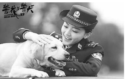
电视剧《警花与警犬》海报