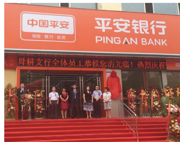
□王爽 报道 ▲平安银行济南舜耕支行6月21日正式开业。

本报济南讯 平安银行济南舜耕支行6月21日正式开业。在大型战略客户的支持下，该支行首日存款规模突破30亿元，实现了“开门红”。 记者了解到，平安银行济南舜耕支行于2015年12月25日经监管部门批准开始筹建，并于2016年6月8日试营业。作为一家新成立的支行，该支行在公司业务方面，将深挖主流市场，深耕主流客户，努力夯实在投行、贸融、网金、小企业等特色产业方面的优势，做一家以新业务、新产品为主打的集约化经营特色支行；零售业务方面，该支行将立足社区，充分利用地利位置优势，做好业务调研，辐射周边大型社区，为周边居民做好综合金融服务，将其打造成平安银行在济南南部地区的一座深入人心的规范化金融窗口。