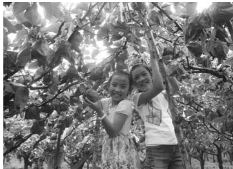
杏坊村黄金梨采摘节,每年都会吸引上万游客。