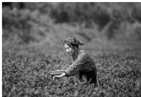
后村镇拥有3.8万亩茶园,发展“茶乡之路”生态旅游条件得天独厚。