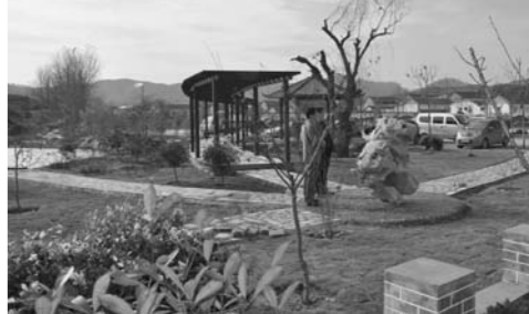
集中连片治理后的杏坊村面貌焕然一新。