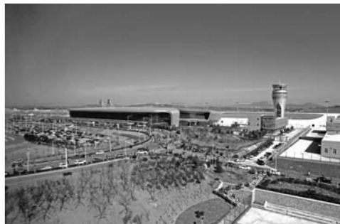
日照山河机场,给后村镇的发展带来了希望。