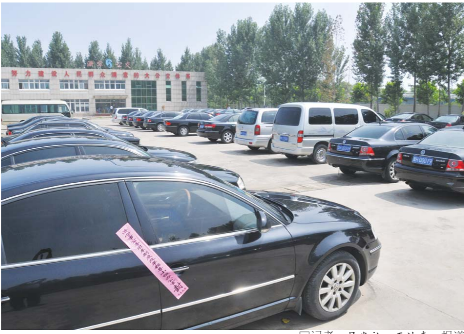
截至6月27日上午，52家市直单位共移交封存206辆公务用车。

根据中央、省车改政策要求，市级党委、人大、政府、政协主要负责人，11个县（市、区）、156个乡镇（街道）党政主要负责人可以选择保留车辆，但须严格规范管理，不得再领取公务用车补贴。市级保留4辆，县（市、区）级保留22辆，乡（镇、街道）级保留312辆。车改后，只保留必要的机要通信、应急、特种专业技术、行政执法、行政执法、接待调研等车辆。