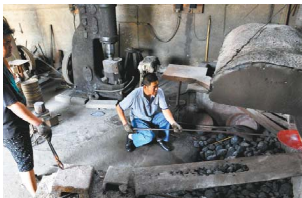
一件好铜响乐器要反复捶打、淬火。