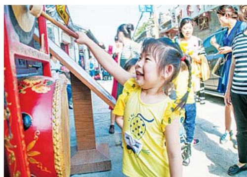
□马桂路 报道 一些非遗项目“人气”颇高。