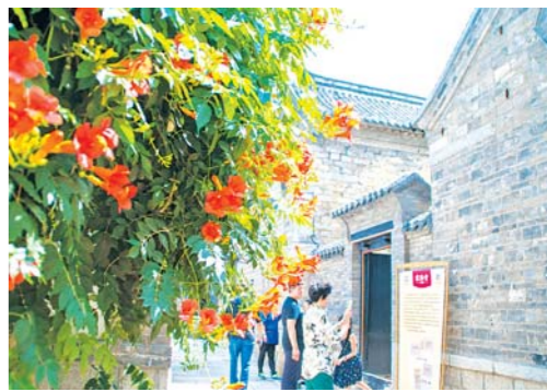
□马桂路 报道 花园簇拥下的老建筑别有韵味。