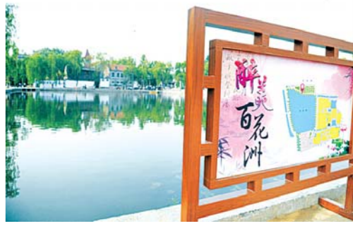
□通讯员 杨荣超 报道 微风徐徐，碧波粼粼，百花洲醉游人。