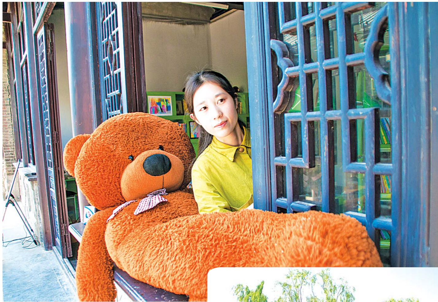
□马桂路 报道 装扮一新的店铺待客来。

这老城区内，藏“宝”更是不少。自2014年的10月1日开始，在明府城保护与改造现场办公室等单位共同发起了“再现明府城”征集老物件、老照片活动，一年多来所收集到的数千件老物件、老照片，分别从不同侧面展示着济南这座古城的过往。展示活动期间，人们更可以透过这些珍贵的历史文物和史料，解读它们背后的故事与情怀——其中，有清代御书正大光明匾，据传原悬巡抚大堂，系道光十四年春立，应为临攀顺治御书，1928年日本攻占济南后，流落京津数十载，后人几经查询考证，终觅得并带回济南；光绪20年山东布政使司执照、国子监执照、户部执照，出自济南府章丘王姓家族，品相完好，要件齐全（含信封），目前在国内外所见甚少，是一件非常珍贵的文物史料收藏品，对于研究清代教育、官员任命、捐例等具有重要参考价值；后宰门太和阁碑，原为济南太和阁药店的广告碑，碑文为楷书，约有170字，刻于乾隆四十八年（1783年），原立于后宰门街5号墙体，县西巷拆迁改造时流失，几经辗转流离，后被市民妥善收藏，该碑记载了太和阁药店在开办过程中每逢初一、十五半价售药的原委，是迄今所发现的济南最早的医药广告碑，是关于清代济南商业活动的实物证据；英国“谋得利”老钢琴，系民国初年，上海一富家女嫁到济南的陪嫁，该琴由中国第一家钢琴制造工厂“谋得利上海钢琴有限公司”制造，如今，尽管外形因年代久远而有些破损，但在声音的悦耳和弹奏上至今仍未逊于当下的钢琴；还有齐鲁第一落地钟，重锤工艺，高2.7米，德国制作，来自德华银行，中西合璧，至今计时准确，见证济南近现代百年岁月；还有济南最早的冰箱，最早的保险柜、第一张明信片（1903年）、最早的航拍