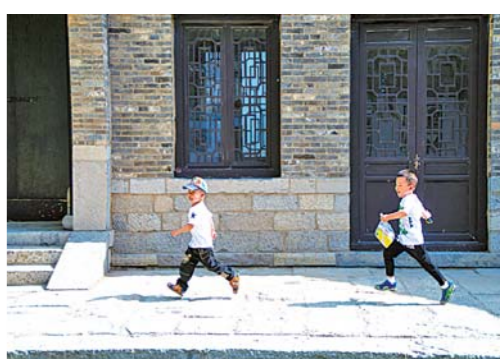
□马桂路 报道 孩子们在百花洲仿古建筑前嬉戏。