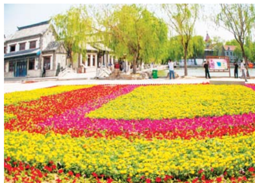
□马桂路 报道 对外开放的百花洲成了花的海洋。