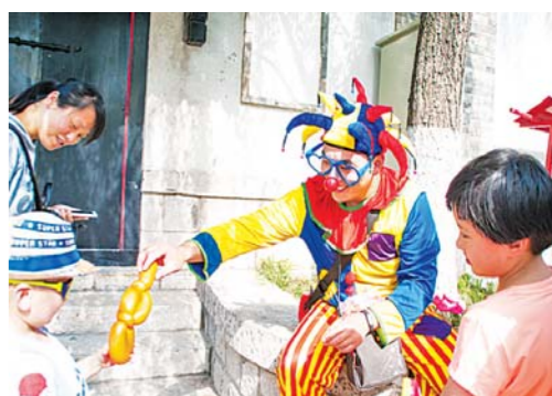
□马桂路 报道 打气球的艺人和孩子打成一片。