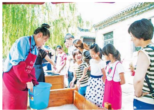
□马桂路 报道 传统的制纸工艺吸引了不少人来体验。