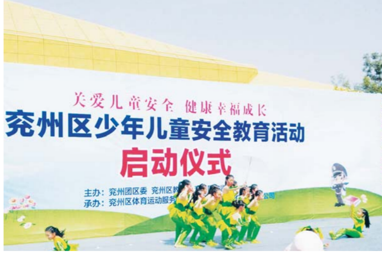
△安全教育从娃娃抓起

办的，以及全区重大安全隐患实行区政府挂牌督办的，全部督促企业整改到位，消除隐患，确保安全。