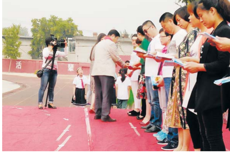
△“五个一安全校园行”赠送安全书籍