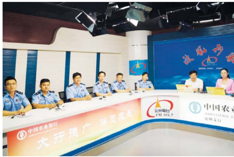
△兖州安监局在行风热线接受社会监督