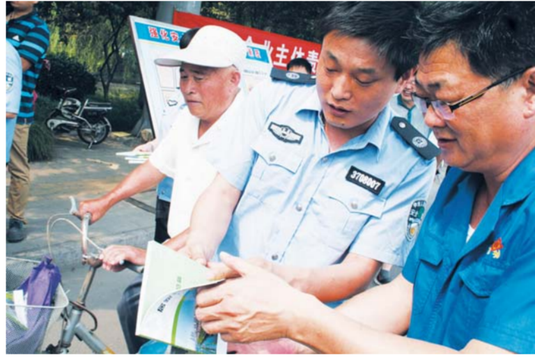
△社会宣传常态化，唤起群众安全自觉