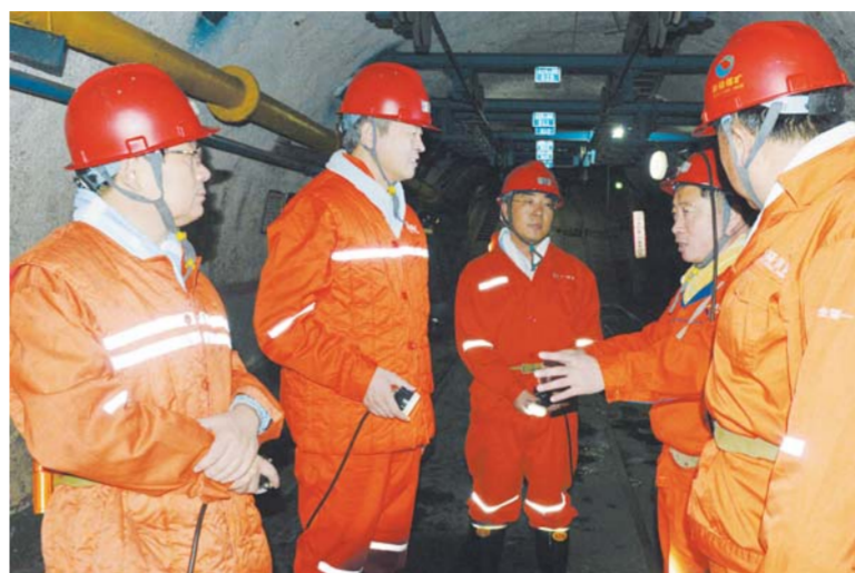
△兖州区委副书记、区长王骁(左二)到矿井检查指导安全生产

同时，区政府强力推进企业安全标准化建设，目前全区危化品、煤矿、发电、建筑施工及重点工商贸企业全部通过安全标准化评审和验收，其中29家达到二级标准化，企业本质安