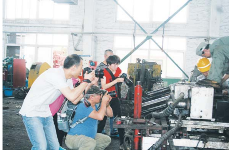
△摄影家采风，安全文化以文化人

全水平得到较大提升。全面整治规范烟花爆竹经营市场，确定保留1家批发经营企业和19家长年零售经营户，并严格进行条件审查。区财政拨款142.5万元，高标准建设了综合监管平台和视频会议室一期工程，督促174家企业按要求填报综合监管信息；全面规范企业安全生产应急预案的编制、评审、备案、演练等工作，全区应急预案备案企业达到571家。十多年来，全区没有发生较大及以上生产安全事故，连续7年被省政府授予“全省安全生产基层基础先进县(市区)”，2015年在济宁市各县市区考核中再次取得第一名的成绩。