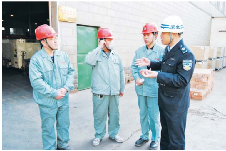
△安监局执法人员在企业执法大检查