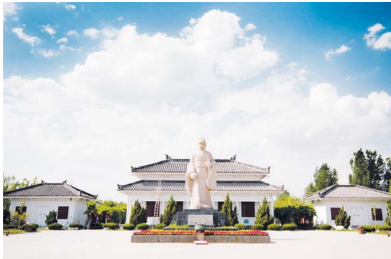
△滨州中国孙子兵法城