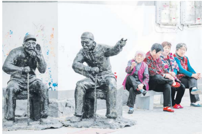
△滨州乡村旅游典范——狮子刘村