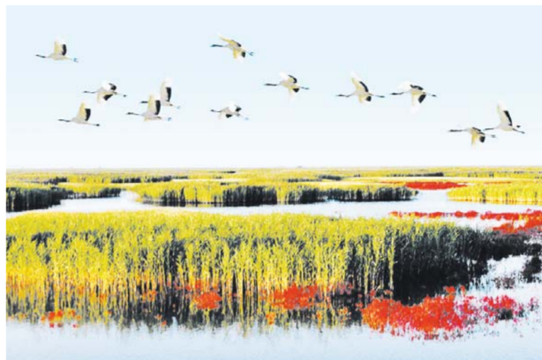
△滨州黄河岛湿地风情

居、非物质文化遗产进行创意化、体验化开发，将文化元素融入休闲、度假、娱乐、研修等特色产品开发之中，并积极发展文创产业，推动滨州文化旅游从观光产品主导向体验、创意休闲、度假等高层次产品转化。