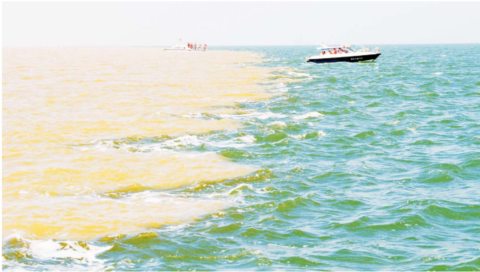
△黄河入海口“河海交汇”景观

打造的旅游目的地品牌。黄河口生态旅游园区在不断完善景区服务设施，丰富旅游产品基础上，启动国家5A级景区创建工作，突出打造“黄河入海”旅游品牌，全面提升景区档次和水平，力争2017年底完成创建任务。东营市市长组织全市各相关部门召开动员大会，制定了详尽可行的创建方案，各部门单位各司其职，形成全市上下齐心创建的工作合力 and 良好氛围。