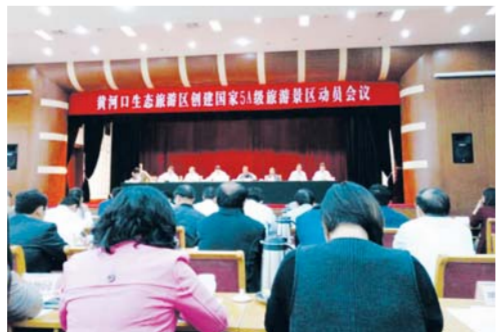
△黄河口生态旅游区创建国家5A级旅游景区动员会

交汇、野生鸟类和原生湿地等核心产品为重点，全面提升景区旅游服务质量，将黄河口生态旅游区打造成为宣传推介东营的一个亮丽名片，打造成为世界知名、全国著名的旅游目的地。目标是依据国家《旅游景区质量等级划分与评定》细则，确保服务质量与环境质量评分950分以上，景观质量评分90分以上，游客意见评分90分以上，于2017年7月底通过省旅游局检查验收，12月底通过国家旅游局检查验收，成功创建为国家5A级旅游景区。