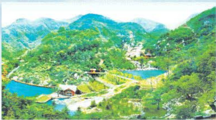
△南部生态经济区项目——九如山