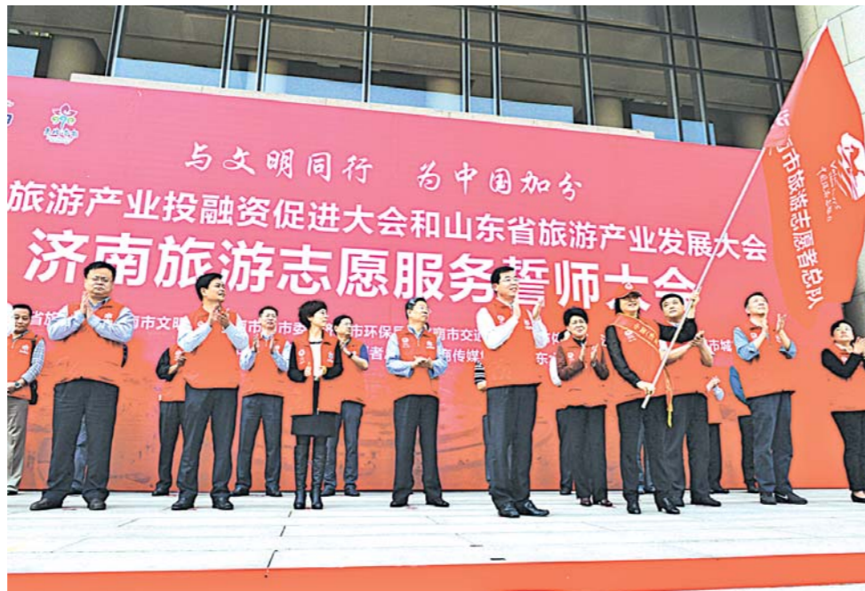
▲5月10日上午,由省旅游局、济南市旅游局主办的中国旅游产业投融资促进大会和山东旅游产业发展大会旅游志愿服务誓师大会在山东会堂广场举行。省及济南市旅游志愿服务联盟首批26支旅游志愿服务队伍代表共300人参加了誓师大会。

以此为背景,去年以来,山东因势利导,推动旅游投资率先向那些游客们感受最慢的薄弱环节。陆海空立体交通体系构建速度明显加快,增开航班航线和客运班列班次等举措有效改善了全省旅游的通达性和便利性。发挥“城市会客厅”作用的游客服务中心建设加速,目前全省已建成旅游集散中心36处,建成旅游咨询服务中心152处,总投资近12亿元。针对旅游感受最差的如厕难问题,除“两区一圈一带”财政切块资金,省级两年还统筹共1.2亿元采取以奖代补