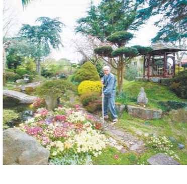
日本前和尚35年建一座8100平米园林

美国28岁警察科迪·加勒特在雨中救了一只小猫，带回家饲养，并带着它一起巡逻，一人一猫的照片立刻在网上走红。