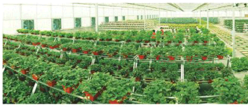
△聊城市现代农业科技示范园智能温室