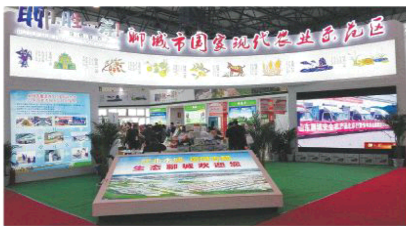
△聊城市示范区展区

聊城的特色在于“水”, 全市流域面积在30多平方公里以上的河流有23条, 市区内有我国北方最大的城市湖泊——东昌湖, 黄河、京杭大运河、南水北调东线工程都从聊城经过。全市农田林网面积达到640万亩, 林木绿化率达到了37.5%, 湿地保护率65%。境内的位山灌区是全国六个特大型灌区之一。在这块广袤的土地上, 土质良好, 四季分明, 光照充足, 雨量适中, 非常适宜粮食、蔬菜、水果和其他经济作物生长, 也是为畜牧业和农产业发展提供了良好的自然条件。聊城8个县(市、区)全部被列入全国新增千亿斤粮食产能规划, 全国蔬菜重点区域发展规划和沿黄肉牛羊肉高品质高效产业区, 5县被纳入山东半岛高端肉产品出口加工区。好水土, 成就好食物。良好的生态环境, 生产了消费者期盼的安全优质农产品。