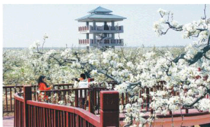
△冠县“中华第一菜园”