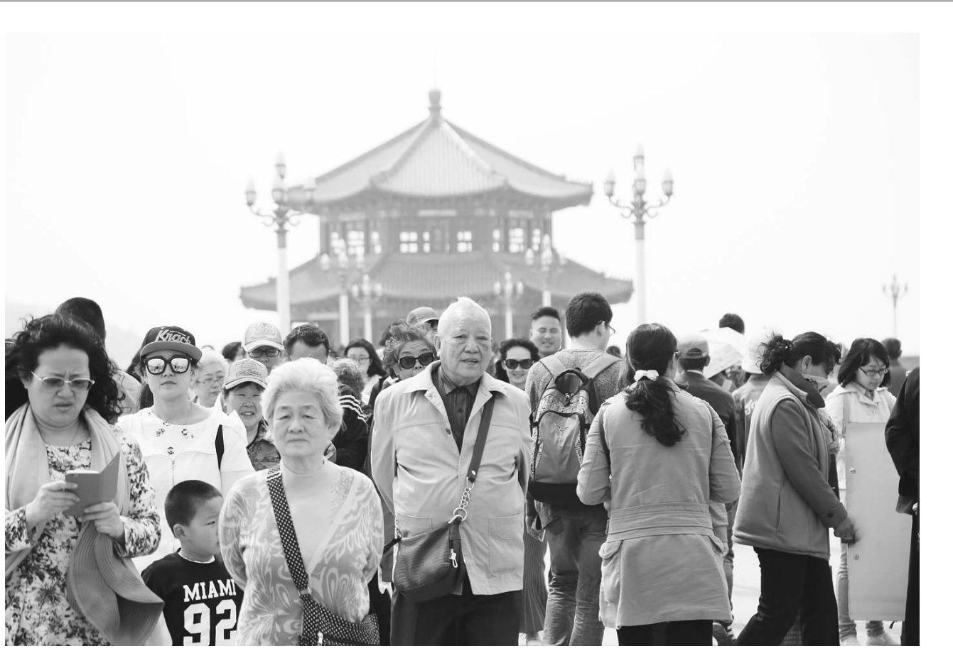
□记者 薄克国 报道