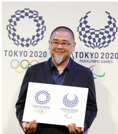
2020年东京奥运会、残奥会公布新版会徽

当日惠子程开局表现一般，但后期发力，最终以463.7环的总成绩创造了新的决赛世界纪录。对于在最近几次国际大赛中都超过埃蒙斯夺冠，他仅说是“自己运气比较好”。