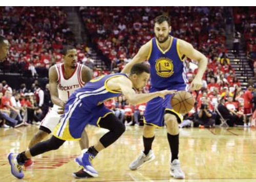
北京时间4月25日，库里（前）在比赛中。