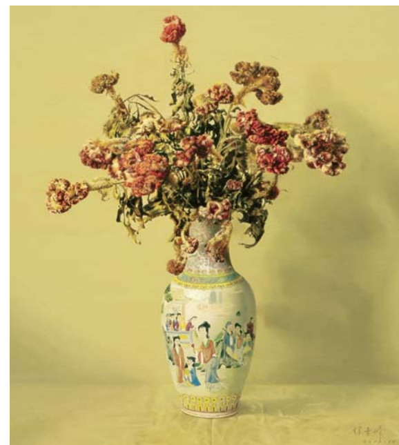
△《千花系列》之二 油画100×80cm 2003

可是，徐青峰实在当不了“闲人”。画室一楼的国画突然让他迸发了灵感：“画中国画只要不是工笔画，用时都不会太长，方便调节休息时间。加之从小受启蒙老师国画画家杨元武先生的熏陶，对水墨并不陌生，我可不做闲人呀。”