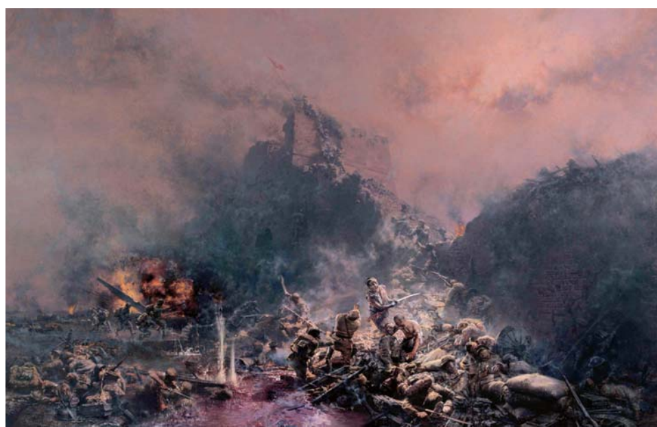
△血战台儿庄 油画 250×400cm 2009