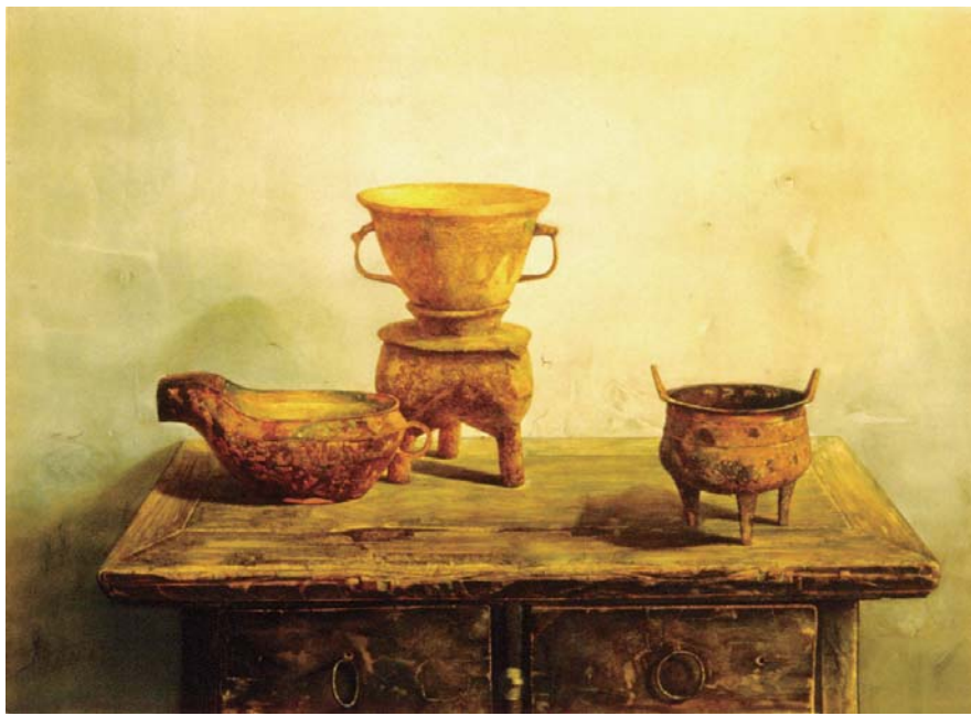
△青铜时代 水彩画 95×115cm 1996