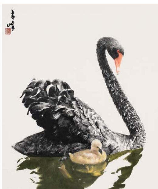
△天鹅之十六 国画 68×68cm 2015

徐青峰在创作随笔中说：“我们这一代人，是从小看着抗日战争影片长大的，这使得我们心中或多或少地有着理想主义、英雄主义情结……后来学习美术专业之后，就总想有一天画一张‘打仗’的画，来弥补自己没当过兵的遗憾。”通过深入思考，他创作出了一张独一无二的“我”的战争题材历史画，完成了对重大历史事件的深切缅怀。