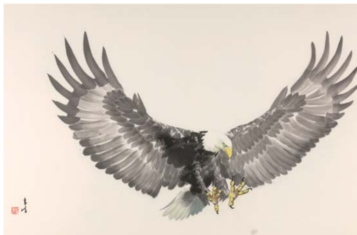
△浩气凌云 国画 94×179cm 2015