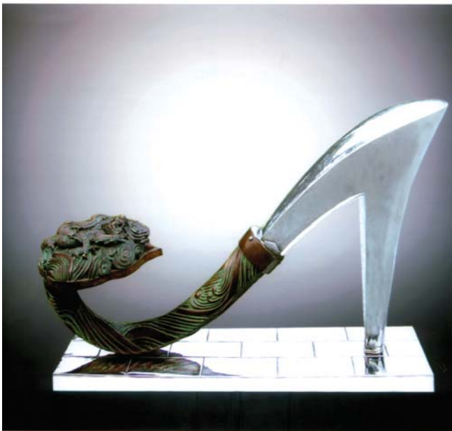
杜华 雕塑 乾坤 140cm x 58cm x 80cm