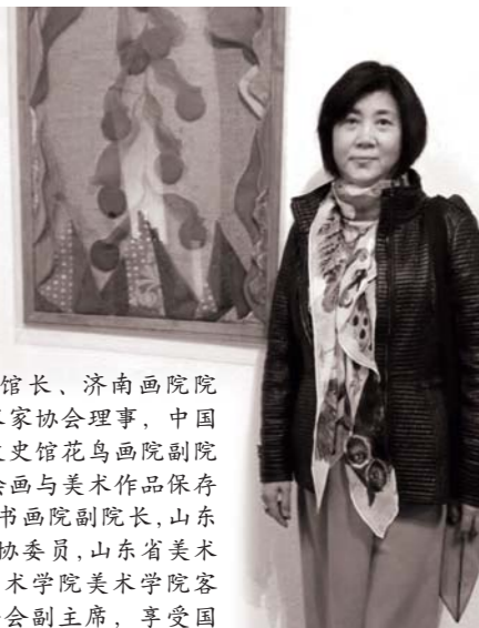
杜华在意大利当代艺术馆

杜华 现任济南市美术馆馆长、济南画院院长，国家一级美术师，中国美术家协会理事，中国艺术研究院研究员，中国政协文史馆花鸟画院副院长，中国美术家协会综合材料绘画与美术作品保存修复艺术委员会委员，中国长城书画院副院长，山东省美术家协会副主席，山东省政协委员，山东省美术家协会策展委员会主任，山东艺术学院美术学院客座教授，济南市文学艺术界联合会副主席，享受国务院政府特殊津贴。先后在法国埃克斯国家艺术学院和中央美术学院作高级访问学者。