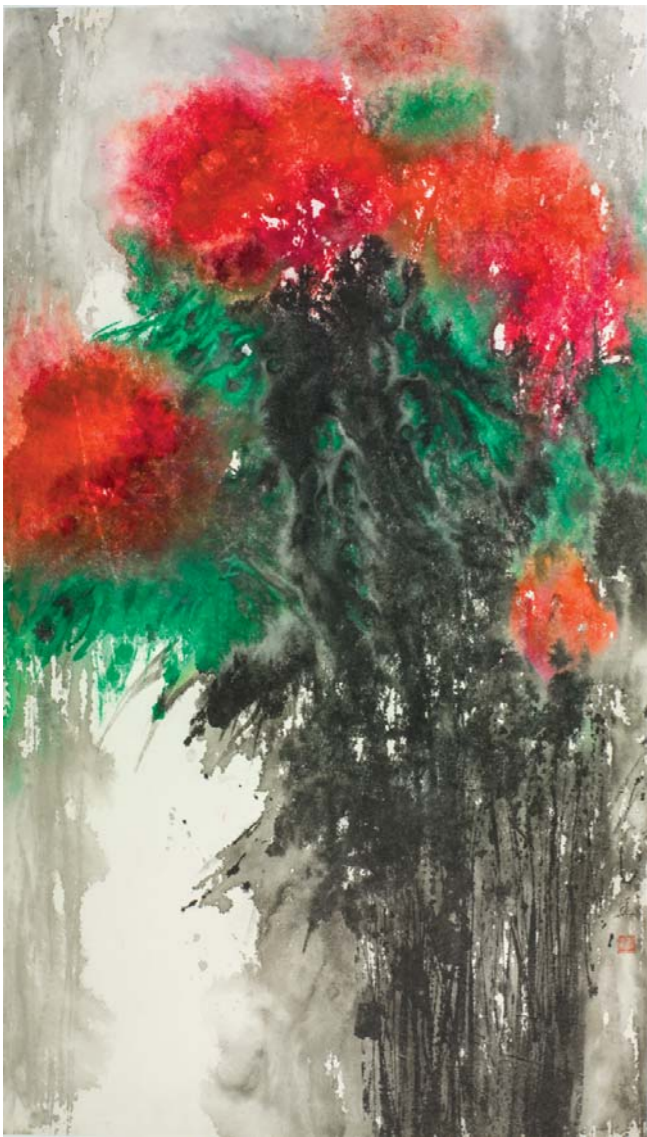
杜华 繁花系列 180cm x 110cm

杜华是一位花鸟画家，她有思想、有才华并有追求。几十年来，她通过自己不懈的探索逐步完善着心中近乎完美的绘画意向。像她的为人一样，她的作品给人留下一种静谧、含蓄、精致、端庄的印象。在她的作品中，你能够处处感受到东方传统文化与西方古典艺术的完美融合与相互渗透，能够时时倾听到自然万物与花卉草虫向我们传达出的如天籁般的低吟浅唱。她以中国传统的扎实底蕴，借助于西方色彩的理性渲染，使得笔下的每幅作品都彰显出一种如梦如幻的唯美意境。这种朦胧玄美的花鸟画意境让我们真切地感受到了一种与审美心律合拍的温馨共振。她的这种逐渐成熟了的探索与实践，使得她的作品具有了独特的只属于她自己的鲜明特色。这在从事花鸟画创作的画家中是难能可贵的。