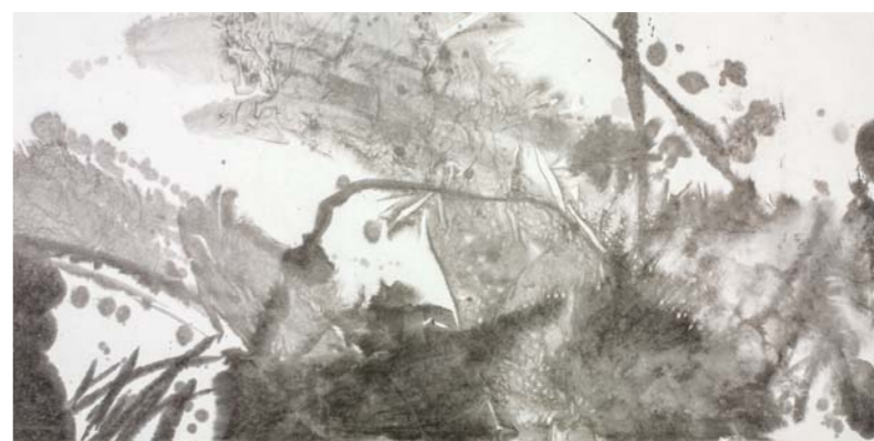
杜华 印象水墨 138cm x 69cm