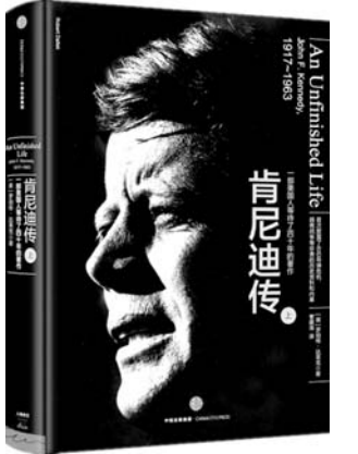
《肯尼迪传》 【美】罗伯特·达莱克 著 中信出版集团

仓央嘉措的一生充满传奇，住在布达拉宫，他是雪域的王；流浪在拉萨街头，他是世间纯美的情郎。这个极具才华的诗人写下了感动人间的情诗，在三百年前感动了无数人，在三百年后依然在感动着现在的人们。他用生命，演绎了一场诗歌之美。