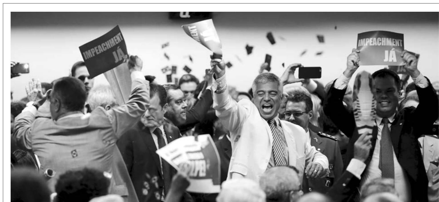
4月11日,在巴西首都巴西利亚,巴西国会议员庆祝国会众议院特别委员会通过支持弹劾总统罗塞夫的报告。

按照印美双方达成的共识,未来的《后勤保障协议》规定,印美两国军队可在对方陆海空军基地进行后勤补给、维修和休整。