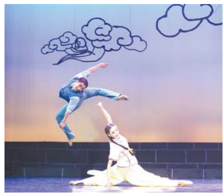
舞剧《风筝》剧照之一。