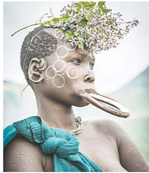
非洲部落族人的唇盘全球最极端人体艺术

在埃塞俄比亚的西南部，居住着一群原始部落族人。他们因唇盘而为大众所知。部落中的人将自己的下牙全部敲掉，然后戴上巨大的唇盘，在他们看来，这个唇盘对于女人来说是美丽和地位的象征。