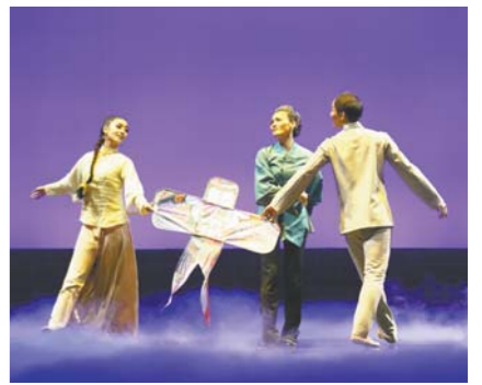
舞剧《风筝》剧照之一。