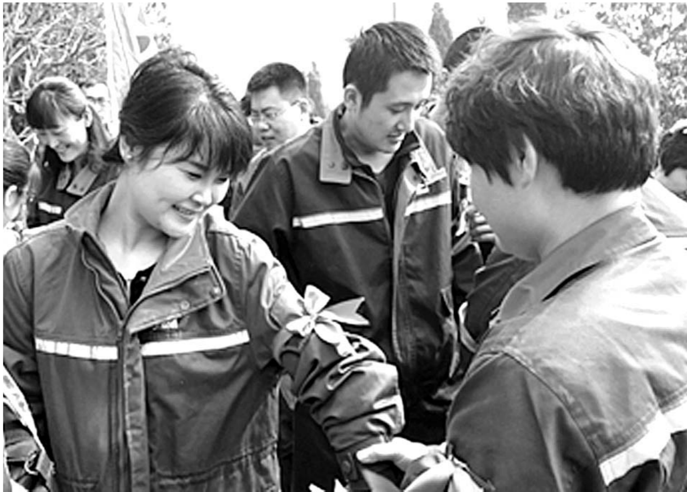
□李玉军 张思凯 报道 3月18日,中国石化山东石油分公司为弘扬绿色环保理念,践行“碧水蓝天”计划,以“碧水蓝天·绿丝带”为主题,组织62名干部职工及青年团员在“山东省团委青少年培训基地石化林”,栽植樱花树100多棵,为山东省的“天更蓝、水更碧”及空气环境治理,再次作出积极贡献。

强化信息化建设,提高安全监察信息化、智能化水平。充分运用互联网+、大数据、云计算、物联网等新技术,大力推进煤矿安全远程监察和事故风险分析平台及大数据试点工程建设,增强防范管控能力,力促煤矿安全生产形势持续稳定。