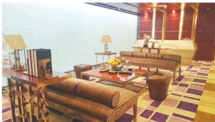
△济南恒大财富中心样板间