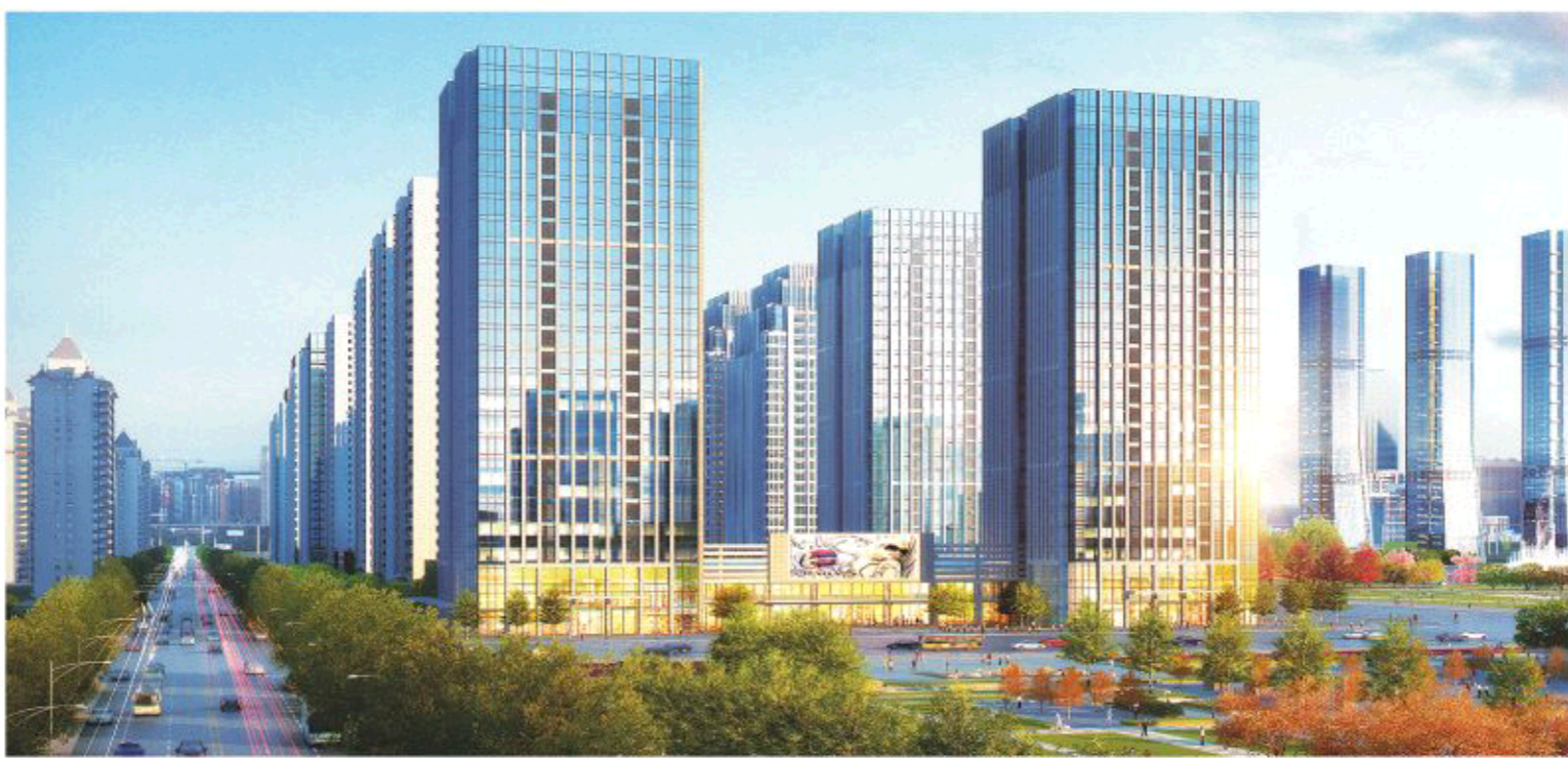
△济南恒大财富中心效果图

在“无理由退房”政策实施的过程中虽然也遇到一些困难，然而在民生住宅方面，正是凭借着9A精装品质、大师级湖景园林、奢华级航母配套、完善的物业管理和售后服务、科学的企业内控管理、高品质的工程质量等精品品质的护航，让“无理由退房”承诺坚持了下来。让购房者真真切切地感受到零风险购房免除了购物的后顾之忧。这是恒大地产集团给购房者吃的“定心丸”，也是为恒大提升品质打的一针“强心剂”。