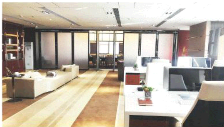
△济南恒大财富中心样板间

恒大地产作为民生企业让投资者买得放心、买得称心、买得省心的优势所在。以济南恒大财富中心为例，恒大财富中心位于济南西客站片区的重要发展地段——济南西部新城的核心板块，是济南市政府重点打造区域。项目紧邻三馆、大剧院、中央公园等市政文化配套；近邻高铁西客站、济南西高速、二环西路、腊山立交等交通枢纽。多维立体