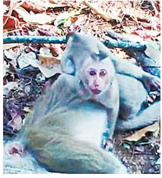
母猴死于车祸 小猴抱尸痛哭

在泰国中部坤育府拍摄的一段视频显示，一只母猴被摩托车撞死后，小猴紧紧抱着母猴的尸体不愿离去，还将自己的脸埋在妈妈的毛里，哭声悲痛。