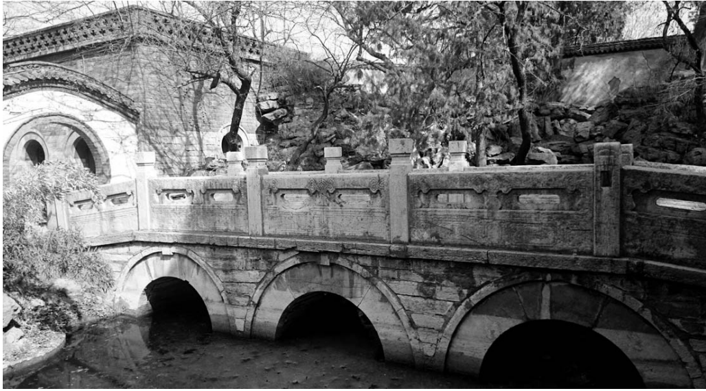
冯溥偶园中的明代石桥

康熙七年（1668年），为官端敏练达的冯溥升任左都御史，官居“都宪”。左都御史为