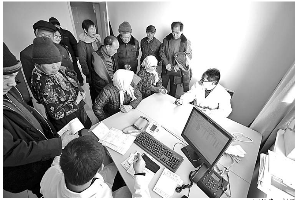
寿光市人民医院专家在医疗集团成员单位侯镇中心卫生院坐诊，受到患者欢迎。