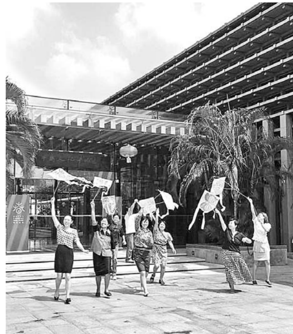
□ 记者 于国鹏 报道 泰国曼谷桥光中学的老师们放飞自己学习制作的风筝，开心得像孩子。

临近演出开始，舞台上忙碌的身影开始减少，后台的演员们开始热身准备。一声锣鼓、坠琴起，演员鱼贯入场，舞台变得热闹起来。观众连声为演出喝彩，更是为此前装台忙碌两个小时的工作人员点赞。