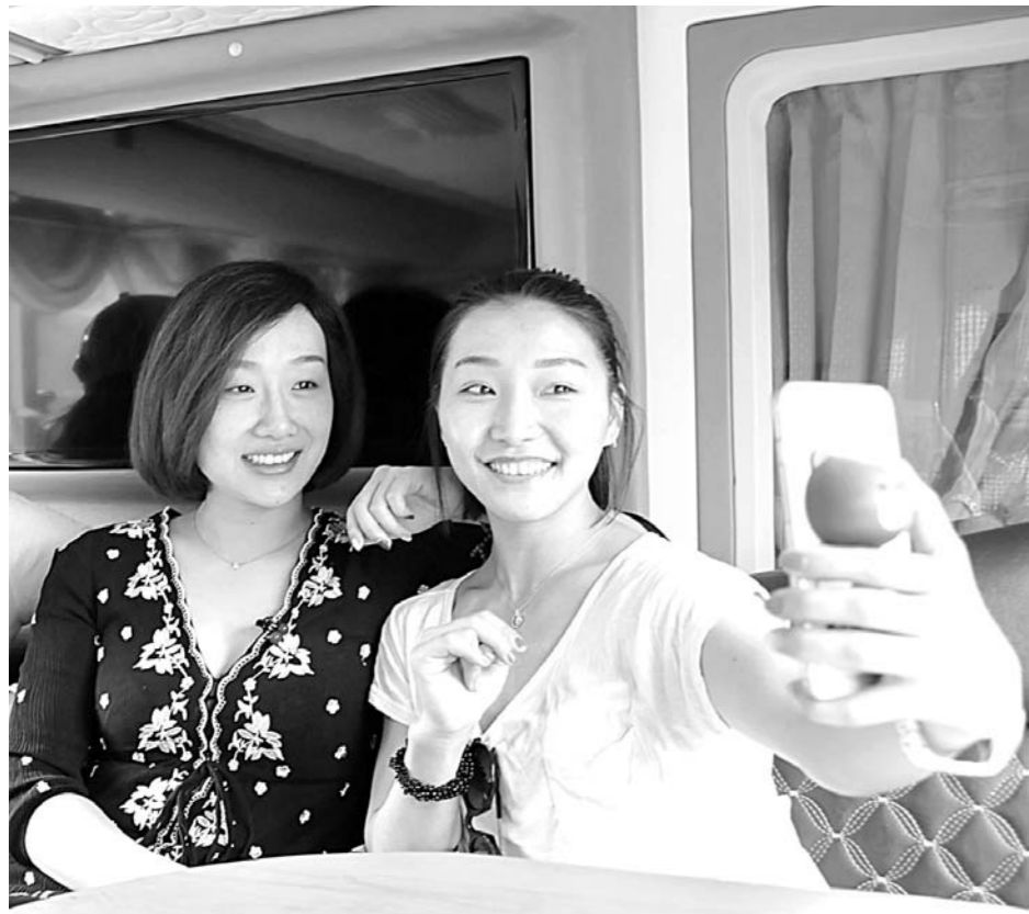
赶往拉玛九世王公园演出途中，演员们自拍留念。