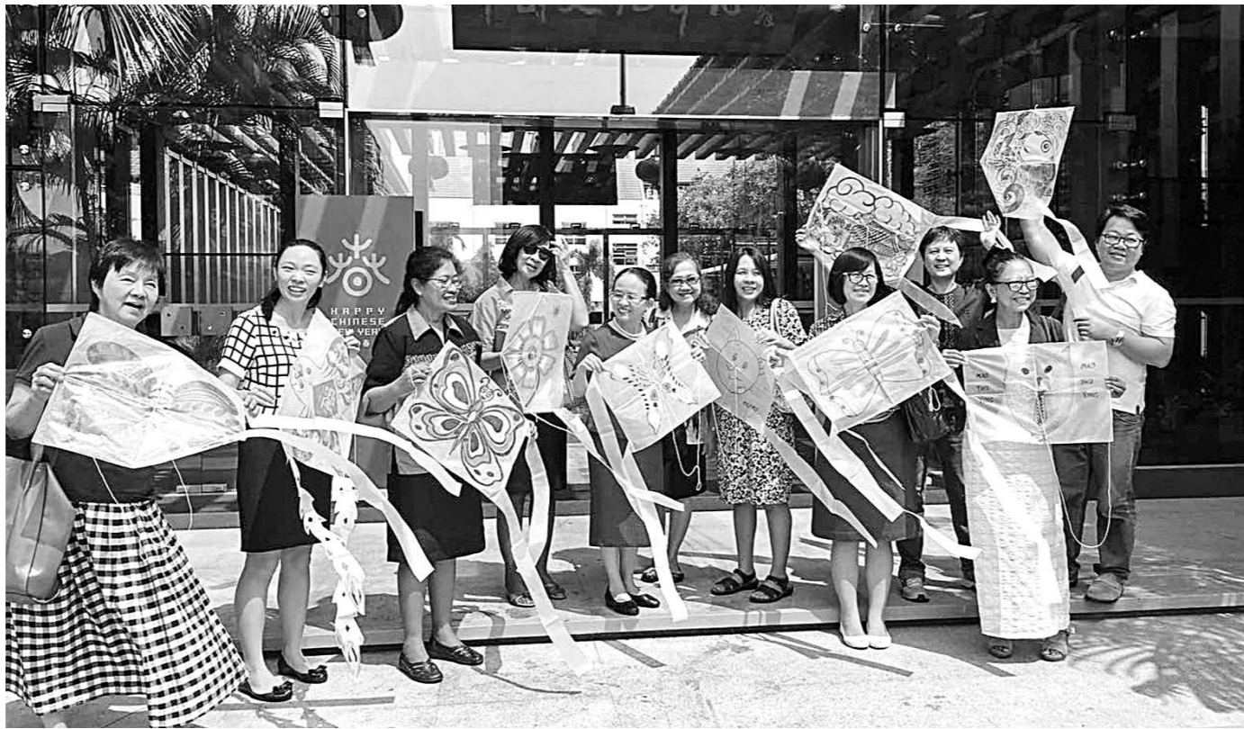
曼谷桥光中学的老师们参加完风筝制作培训班后，正准备自己制作风筝。

作为文化部等主办的“欢乐春节”系列活动的一部分，“泰国·中国山东文化年”的收官之作，省文化厅选派的山东剪纸风筝作品展、杂技演出等一系列文化活动将在曼谷举办。“欢乐春节”活动今年在世界140多个国家和地区的400多个城市举办，共有2000多项特色活动。在泰国的“欢乐春节”活动从2004年开始创办，艺术团从