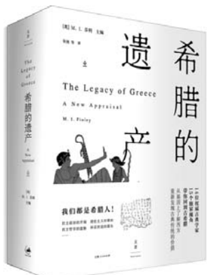
《希腊的遗产》 【英】M. I. 芬利 主编 上海人民出版社

《24/7：晚期资本主义与睡眠的终结》 【美】乔纳森·克拉里 著 三辉图书/中信出版社