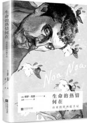
《生命的热情何在》 【法】保罗·高更 著 江苏凤凰文艺出版社

一部希腊的遗产，即是一部现代世界的诞生记；从基因上了解西方，重新发现古典传统的价值。14位世界顶尖古典学家，15个独家视角，精彩追溯现代世界的源头。深刻解析古希腊之于现代世界的伟大意义，堪称经典之作。