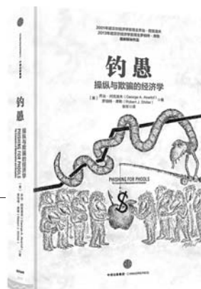
2001年诺贝尔经济学奖得主乔治·阿克洛夫，2013年诺贝尔经济学奖得主罗伯特·席勒最新联袂作品，挑战经济学核心理念，反思自由市场中普遍存在的欺骗行为。市场在为我们带来福利的同时，也带来了灾难。普遍存在的人性弱点、信息不对称等让我们成为“钓鱼”中的受骗者。

显然，如果顾客在这些有纪念意义的仪式上严格遵循量入为出的原则，就会被其他人看作小气鬼。不过顾客的过度消费并不仅仅体现在这些面子工程上。即便在美国这样富裕的国家里，相对于以前，现在大多数成年人都会因为担心自己付不起账单而在晚上辗转反侧。商家总是会有各种办法让我们觉得自己的需求没有得到满足，从而诱使我们不断地买买买。没有人愿意在入睡时还担心自己会入不敷出，但