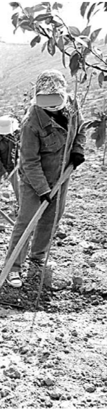
矿山复绿项目工作人员正在泮水镇废弃矿山进行栽树复绿。(资料片)

□记者 刘磊 通讯员 黄凯 报道 本报淄博讯 近日,记者从淄博市城市管理和行政执法局获悉,淄博市城管部门春节期间加强巡查力度,采取划定临时疏导点、实行错峰休息制、设置定点执勤岗等措施严控节日期间市容秩序,严查临时性宣传促销行为。节日期间,淄博市执法人员共取缔各类流动、占道经营摊点960余个,清除各类广告牌80余块、宣传横幅60余条,查处违规临时性宣传促销行为32起。 据了解,节日期间,淄博市城管部门根据市民需要和市容管理现状,在全市城区次干道、背街小巷划定了80多个路段280余个经营区域作为临时性年货市场,销售年货对联、花卉及烟花爆竹等。在车站、广场、公园、主要道路等重点区域及人口密集的小区、城区大集及烟花爆竹临时售卖区域设置了定点执勤岗负责市容秩序管理,每个执勤岗设2至3个执法人员,全市共设置了180多个执勤岗,节日期间有3876人次参加勤务活动。采取错峰休息制度,加强上路巡查,保证城区主要道路、重点区域的巡查力量,严查流动经营、占道经营等各类违法违规行为,全面清理沿街落地灯箱广告,严控横幅广告和临时性宣传促销行为。