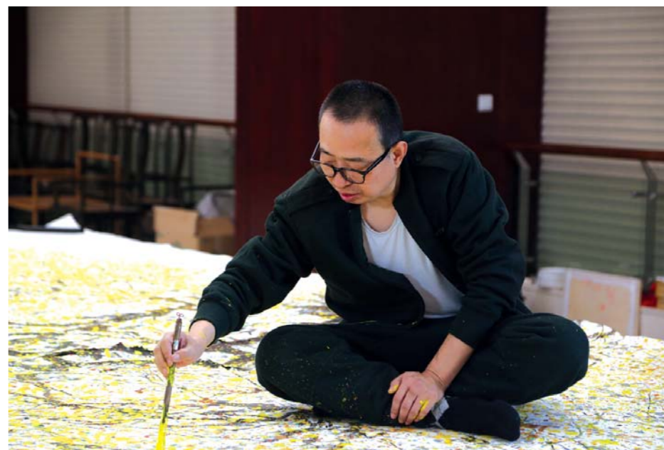
潘鲁生，1962年生，毕业于南京艺术学院，美术学博士。山东省文联主席，中国美术家协会理事，中国民间文艺家协会副主席，山东工艺美术学院院长、教授，山东大学博士生导师。

走进大众传媒大厦，你的目光会立刻被大堂里悬挂的巨幅迎春花作品吸引。粗壮的藤蔓，蟠龙一样虬曲延展；柔韧的枝条，摇曳中有着铁丝一样的质感；最是那灼灼怒放的迎春花，一朵朵、一簇簇、一团团，瀑布般飞泻而下，灿烂无羁，散发着来自山野的自然之气，生生要把惠风和畅的温煦早春，淋漓尽致地铺展到你我面前。