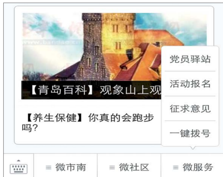
△社区政务微信平台功能丰富，使用方便

“有微信之处就有服务。”2016年，市南区社区政务微信联盟将继续开展丰富多彩的互动活动，汇聚民智，让社区微信平台更好地服务居民，造福居民，居住更舒心，环境更美，生活质量更高，精神文化更丰富，宜居宜居更幸福。