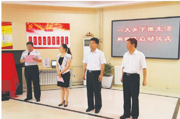
△“八大关下微生活”新媒体启动仪式

市南共同构成，采用先进微信网站技术，实现了微市南和65个社区微信平台之间的相互跳转，是国内首家由辖区内社区联合启动的政务社区微信联盟。居民就像淘宝购物一样，足不出户即可及时准确地了解社区各类动态，提高了辖区居民参与社区活动的积极性。目前该政务微信联盟已拥有粉丝近一百万，成为政府与百姓沟通的新媒体桥梁，政务小微信做出了政府大威信。