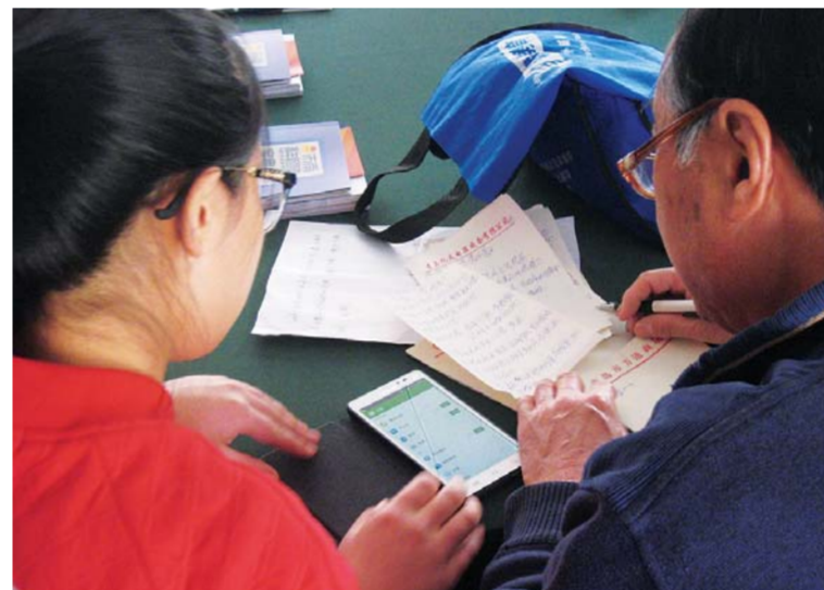
△社区小朋友教老人用微信