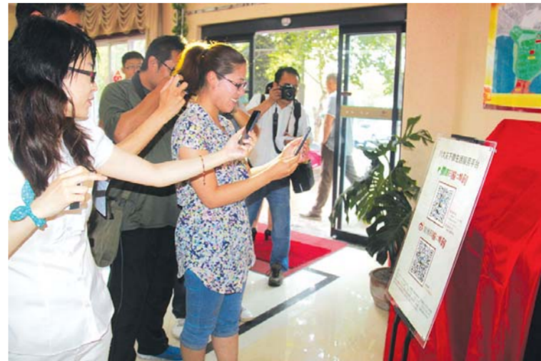
△居民们扫描关注“八大关下微生活”微平台