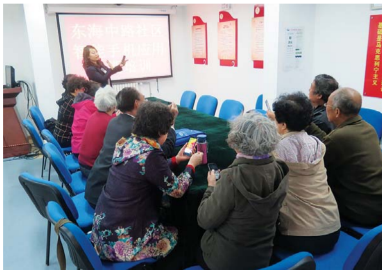
△社区工作人员教居民学微信