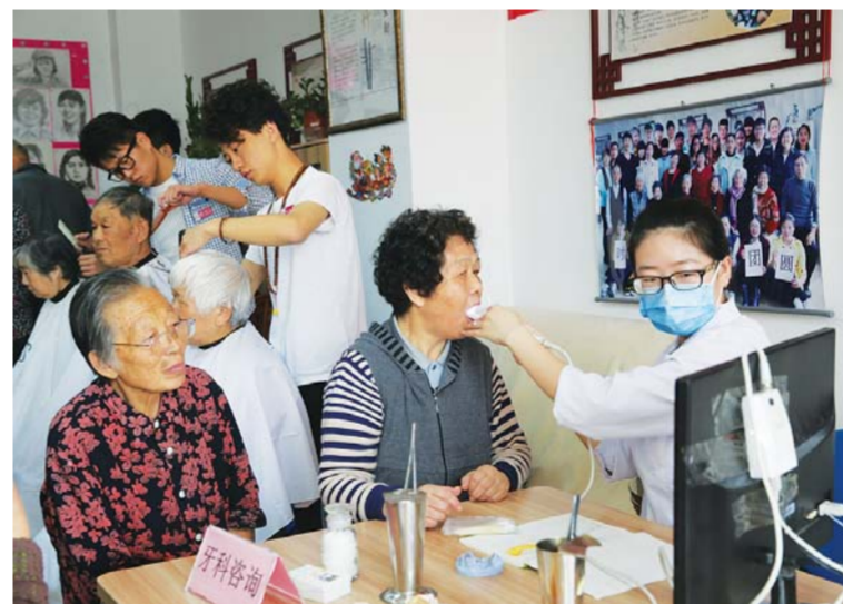
△线下活动之重阳节敬老