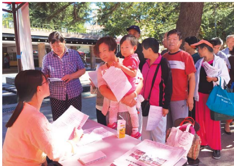
△线下活动之创卫知识问答走进公园