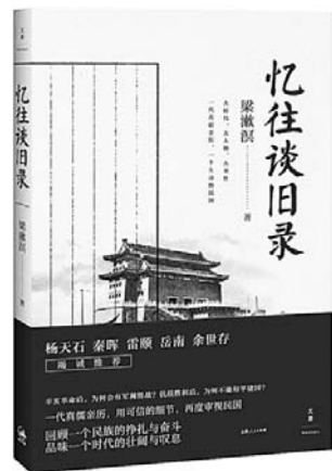
《忆往谈旧录》 梁漱溟 著 上海人民出版社

该书为20世纪思想家梁漱溟先生回忆过往文字的结合，记录了他在辛亥革命、五四运动、北伐前后、抗日战争、国共和谈等多个重要历史时期的重要经历。辛亥革命后，为何会有军阀混战？抗战胜利后，为何不能和平建国？一代真儒亲历，用可信的细节，再度审视民国。