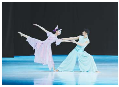
《兰》剧中的香兰和芝兰。