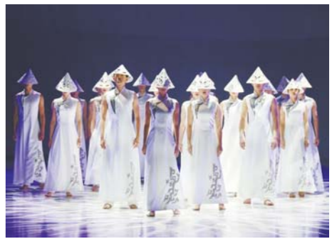
《兰》剧中的先民群舞。

水墨元素贯穿的舞台，看似空旷，却似有生命，主调以黑白两色简约呈现，灯光的冷暖、节奏、强弱重塑舞台质感，动态的投影更像一个虚化的舞者，烘托出舞台需要的不同氛