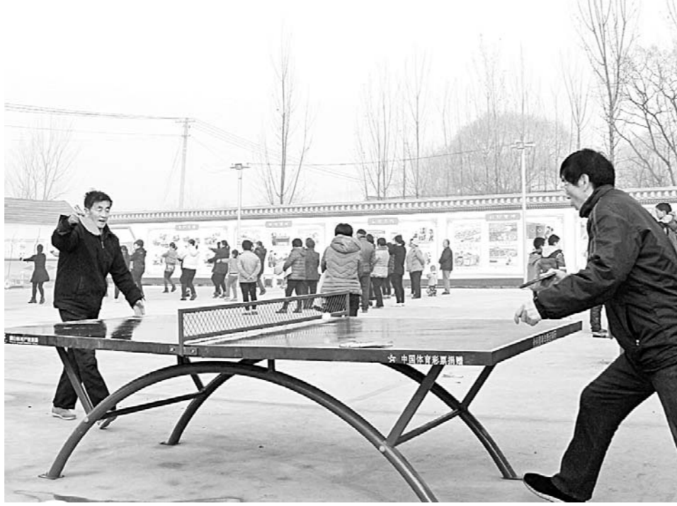
禹城市伦镇李茂芝社区广场，村民在打乒乓球。