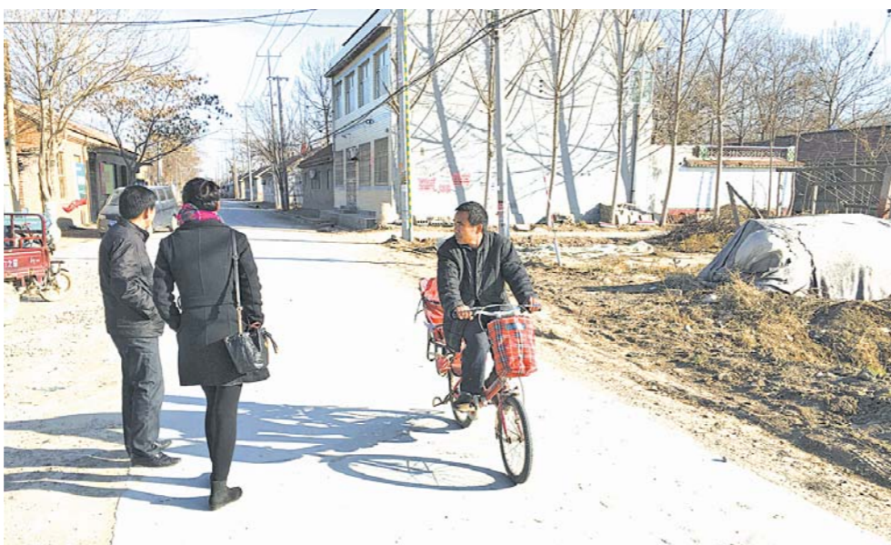
纪台镇孙家村的東西主干道維修後，既方便了收菜、賣菜，也讓村民出行更加舒暢。