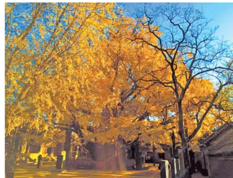
□ 张健 报道

李楠分析，机场的建成通航有力地支持了北京等远距离城市往来日照的自由行。北京的柴颖女士平时周末都是到北京郊区的农家乐或者景区游玩，一直筹划着到山东日照看海，由于来回时间过长挤压游玩时间未能成行，“日照机场建成，这样周末两天时间就能够一个来回了。”