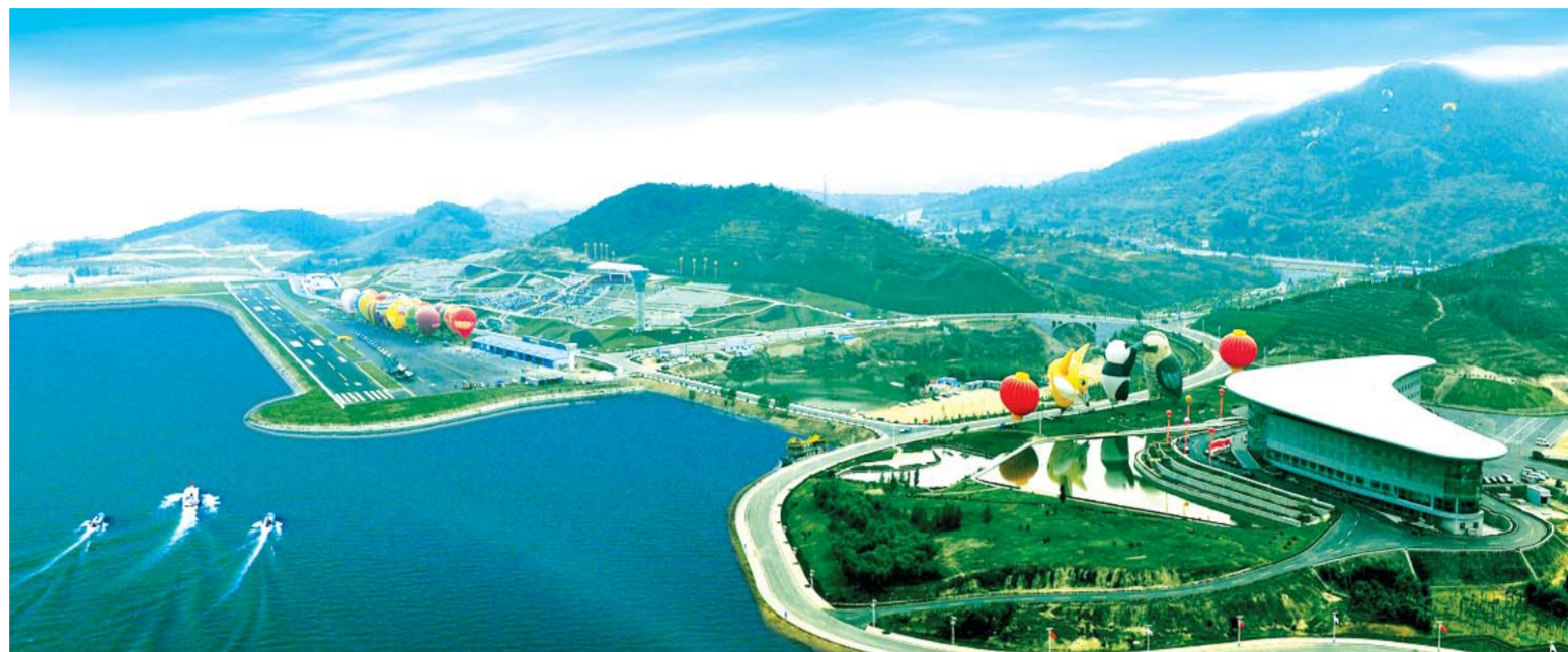
△从天上看雪野成为雪野旅游的最佳角度。