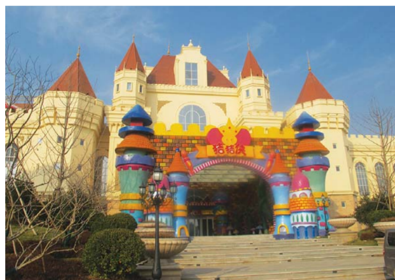
△位于雪野旅游区的恒大儿童欢乐中心。