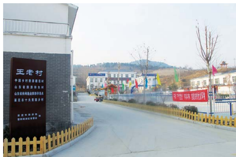
△雪野旅游区王老村是中国乡村旅游模范村。