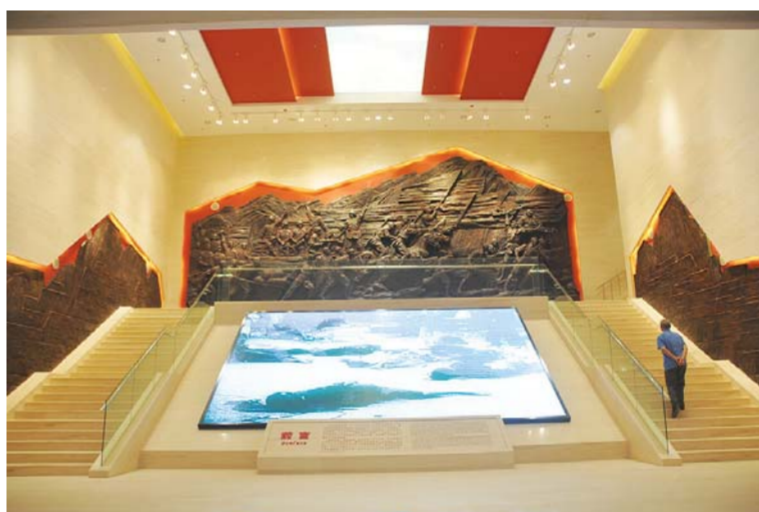
△鲁中抗日战争纪念馆序厅。