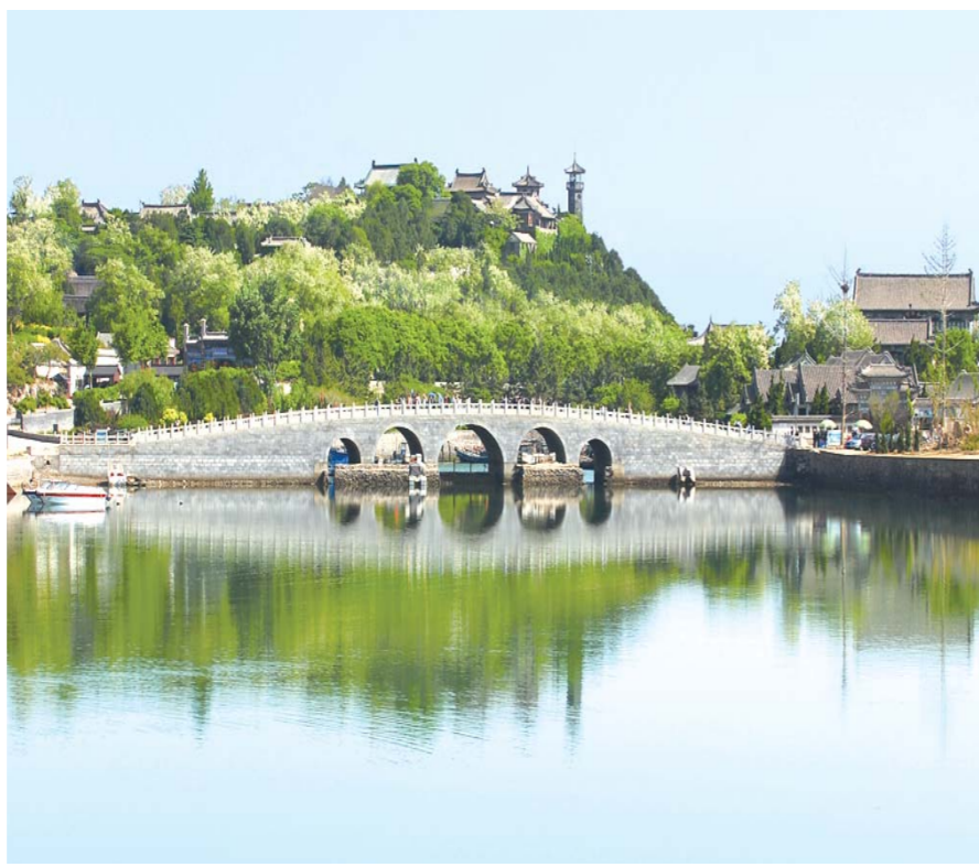
△蓬莱阁远景美如画

今年，蓬莱阁一举收获了标准化建设两个“国字号”荣誉称号，一是以94分的优异成绩顺利通过国家质检总局关于国家级服务标准化