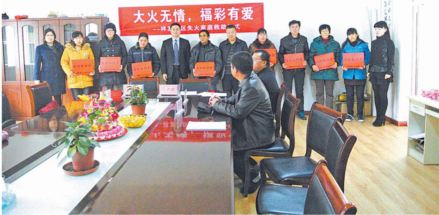
不久前，位于烟台市芝罘区幸福街道祥发社区联排平房中间一户突然起火，火势迅猛蔓延将16间平房烧毁。起火房屋主要是外来打工和幸福八村的居民租住，虽未造成人员伤亡，但房屋严重损坏，日常生活用品全被烧毁。12月9日，烟台福彩中心工作人员为其中8户受灾家庭每户发放福彩救助金10000元，鼓励他们克服困难，重建家园。

□记者 于冬亮 通讯员 张景伟 报道 本报烟台讯 12月9日，烟台市中级人民法院召开全市法院执行工作新闻发布会。继上半年公布488个失信执行人名单后，再次集中公布烟台市内139个失信被执行人名单。截至11月10日，全市法院共录入发布失信被执行人名单24989个，发布数量是去年同期的12.7倍。