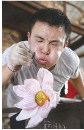
△热成型作品细节制作