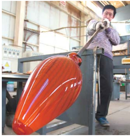
△热成型作品“吹”制场景

热成型工艺，工匠的工作环境相当艰苦。比如做球形琉璃制品，工匠依靠专用工具将材料送入1300多度的炉中加热，并且需迅速拖出，一手拿蘸料的铁吹筒，一手迅速拉出造型。造型灵活多变，全由心生。每步造型都有