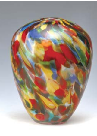
△热成型作品《云霓鼓坛瓶》