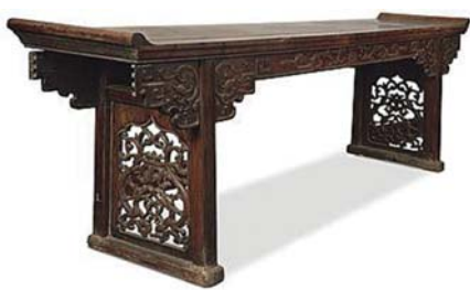
▲以飞檐翼角为参照物的翘头案造型

中国古代的房屋，特别是高等级建筑的屋顶多有“飞檐翼角”，这种独特造型的屋顶可谓是古建筑最有魅力、最引人注目的部分。主要用于四坡及攒尖屋顶建筑物转角处，并使这类建筑物更趋完美，从而丰富和烘托了中国传统建筑艺术的完美性。