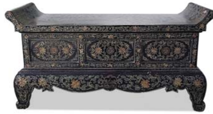
▲清代 绥远城将军衙署的翘头供案

从翘头案的设计来看，古人的生活非常讲究，看画时都要设计一个小小的机关，古代文人那种做事要求至善至美的境界跃然而出。